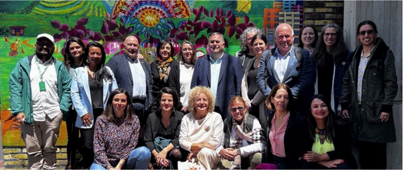
EAEko ordezkariak eta giza eskubideen aldeko erakundeetako ordezkariak (Bogota)

Txosten horrek adierazten dituen dinamiketako batzuk egiaztatu ahal izan zituzten EAEko ordezkariak Kolonbiako lurraldeetara egindako bisitetan, topaketak eta elkarrizketak egin diren erakundeek jakinarazita: